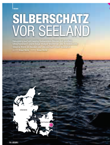
58 Meerforellen sind der Silberschatz vor Seeland