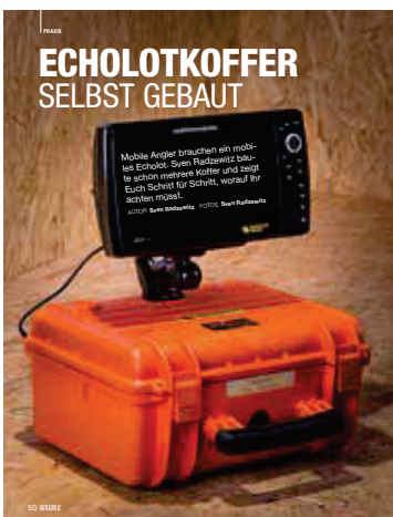
50 Selbst gemacht: Bauanleitung Echolotkoffer